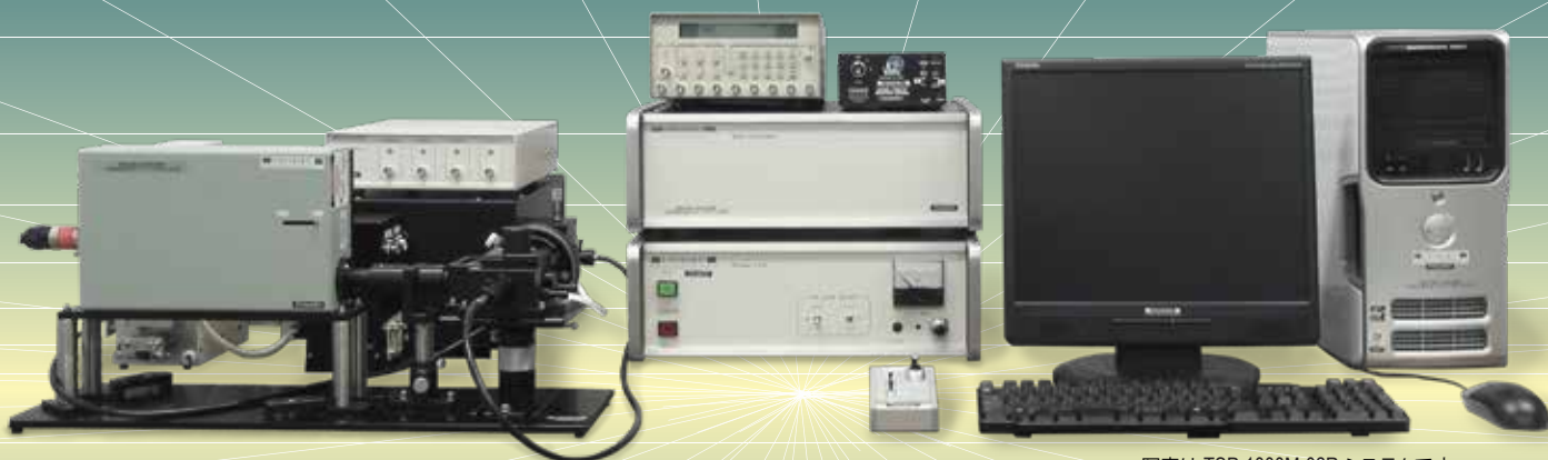
写真は TSP-1000M-02R システムです

レーザーフラッシュフォトリシス法は、パルス光によって誘起されたナノ秒～秒の様々な高速反応を紫外・可視・近赤外領域の過渡吸収・発光などによって追跡する方法です。材料物質・生体分子等の光異性化、三重項-三重項吸収、燐光、電子移動、電荷分離、エネルギー移動、光分解、光反応サイクルといったさまざまな反応機構を解析したり、類縁物質・新規材料の特性評価・比較などを行うことが可能です。