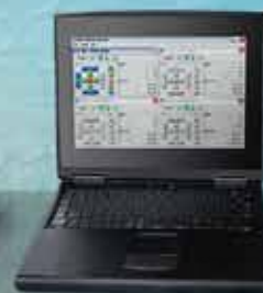
制御観察用ノートPC