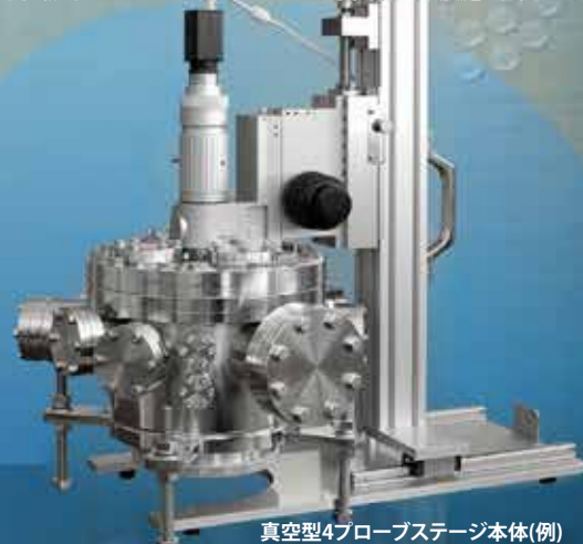
真空型4プローブステージ本体(例)

真空中でのプロービング及び表面測定のための高真空型システムの製作も可能です。どうぞお気軽にご相談ください。